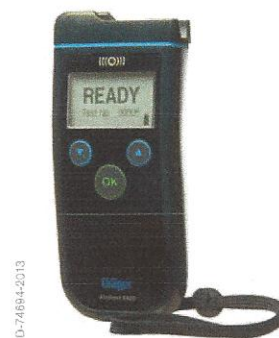
Dräger Alcotest 6820

Alcotest 6820 Vás přesvědčí také svým vyváženým a ergonomickým designem. Díky svému kompaktnímu tvaru se dobře drží v ruce a dá se bez problémů obsluhovat jednou rukou. Náustek přístroje Alcotest 6820 je formován takovým způsobem, že i ve tmě jej lze intuitivně vsadit do držáku - a je přitom jedno, zda přístroj používá levák nebo pravák nebo zda se kontroly provádějí v zemi, kde se jezdí vpravo nebo vlevo. Uživatel má displej neustále před očima. Vyjmutí náustku pro použití je snadné a hygienické.